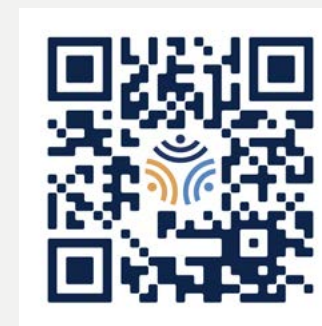
Menú de posibles compromisos